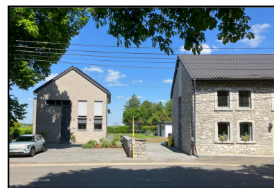
Neubauten: Gute Integration